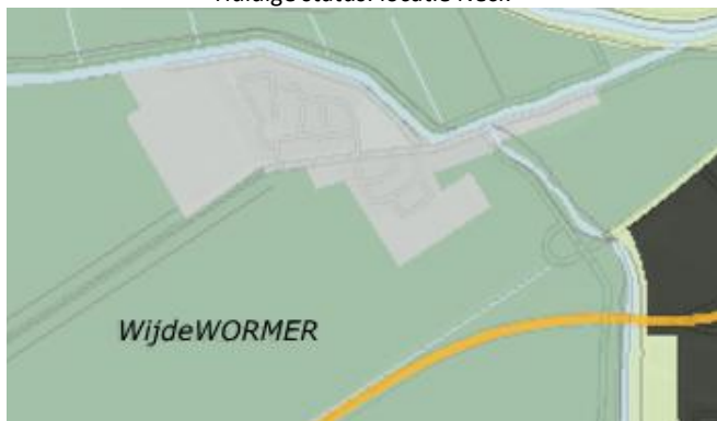
Huidige status: locatie Neck