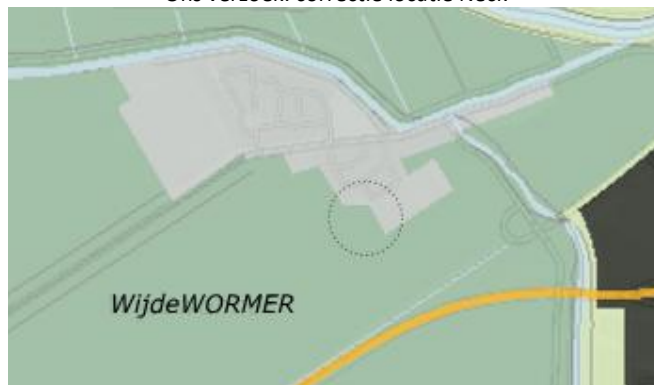
Ons verzoek: correctie locatie Neck